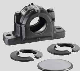
SNC csapágyház + 2 DS kétajkú tömítés + zárófedél