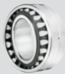
ULTAGE Nyitott, kúpos furatú hordógörgős csapágy