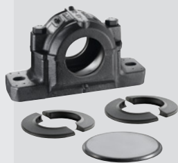
SNC csapágyház + 2 DS kétajkú tömítés + zárófedél